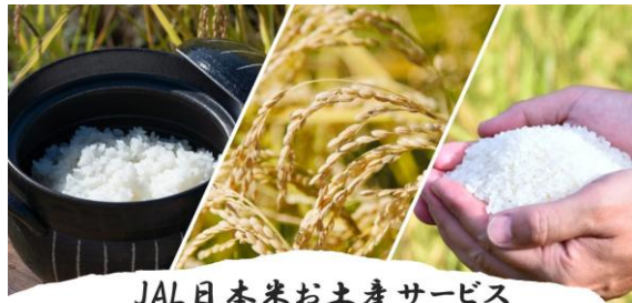
JAL日本米お土産サービス